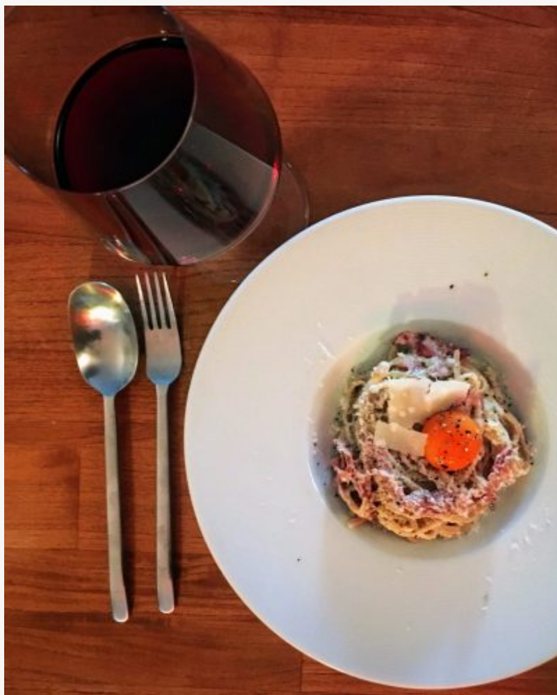
Pâtes carbonara au lard de Colonnata et coppa, accompagnées du Neuf Vingt