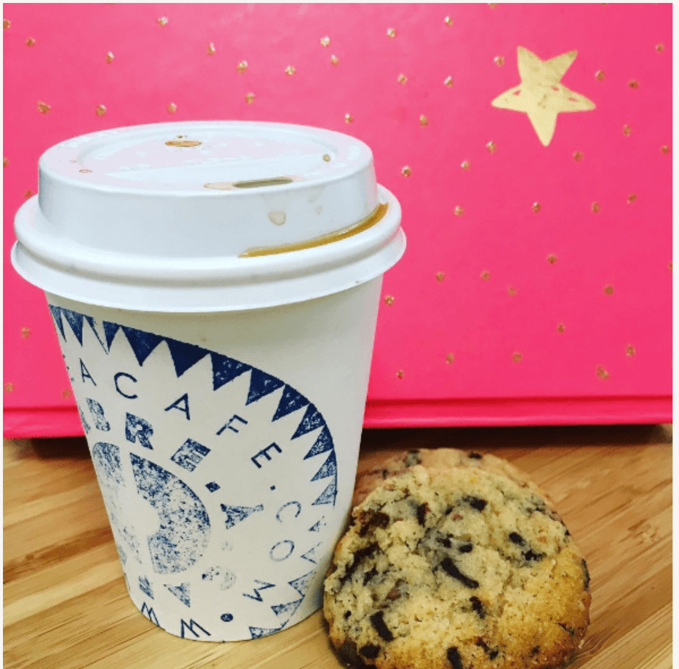
L'arbre à café : 10 Rue du Nil, 75002 Paris – instagram