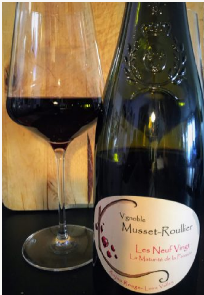
Musset Roullier – Rouge – Les Neuf Vingt