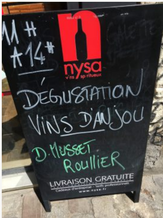
Dégustation chez Nysa Paris 12e