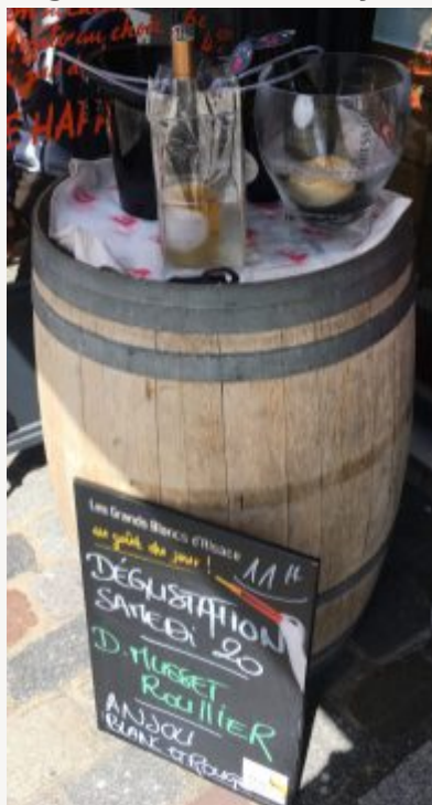
Au soleil, c'est encore mieux :)